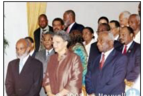
S.E.Mme Michèle Pierre-Louis entourée du Chef de l'Etat, du P.M. sortant J.E.Alexis et de quelques membres du nouveau cabinet ministériel

La cérémonie d'investiture du nouveau gouvernement a eu lieu au Palais National, environ douze heures après l'approbation de la politique de Mme Michèle Pierre-Louis par le Sénat.