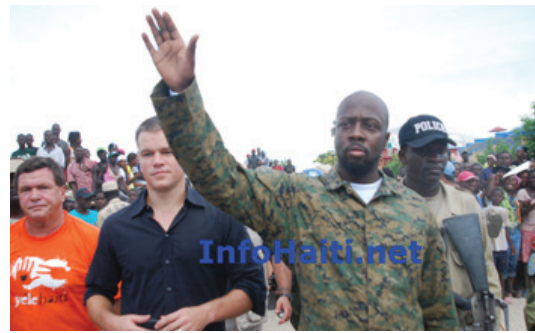
L'Ambassadeur Wyclef Jean aux Gonaïves. A sa droite Matt Damon et l'Ex Premier Ministre du Nouveau Brunswick Franck Mc Kenna

Fort de leur notoriété, ces derniers, à leur retour aux Etats-Unis, promettent