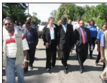
La Première Ministre inspectant la nouvelle route internationale Cap/Dajabón