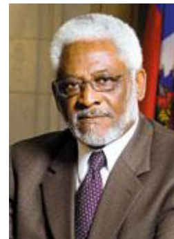
Invited Guest, Ambassador Raymond Alcide Joseph

Unity Day Walk & Celebration is a multi-cultural event, bringing the cities of Banning, Beaumont, Cabazon, Cherry Valley, Morongo and other Inland Empire cities together to celebrate diversity, peace, and harmony in the community. With the support of local retailers, churches, schools, and city officials of the area, residents are uniting to show that differences should not stand in the way of having a peaceful and harmonious community.