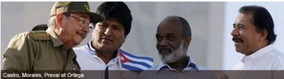
Castro, Morales, Preval et Ortega

Ven. 12 déc. Signal FM – Le Président de la République est de retour après sa participation au 3ème Sommet Cuba-CARICOM tenu à Santiago les 7 et 8 Décembre. Les Chefs d'Etat et de Gouvernement de la région ont durant ces deux jours débattus des grandes préoccupations de la région.