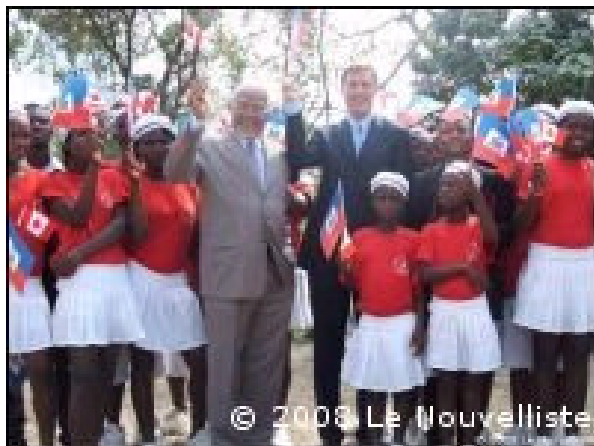
Le Chancelier haïtien, Jean Rénald Clérisme et son homologue canadien, Maxime Bernier, entourés d'enfants, se partageant les drapeaux des deux États