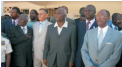
Le Premier Ministre Alexis entouré de quelques parlementaires et notables de la Grande-Anse.