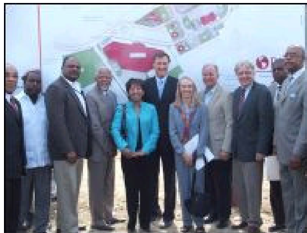
Les officiels haïtiens et canadiens

Consulat Général de la République d'Haïti à Chicago