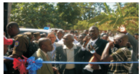
Le Premier Ministre procédant au lancement officiel du projet