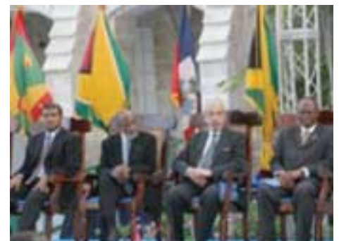
Le Président Préal au Sommet de la Caricom.

Le maintien de la ligne aérienne caribéenne LIA, confrontée à de graves difficultés financières, a constitué un sujet de préoccupation pour les leaders de la CARICOM. Ils veulent empêcher la disparition de cette compagnie qui as-